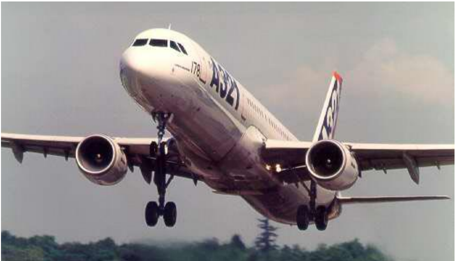
Airbus A321 nousussa.