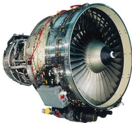
Finnairin Airbusien moottori CFM56-5B.

Kerhossamme on jäseniä vielä yli 750, mutta näistä Suomen Ilmailuliiton jäseniä vain noin 100. Ilmailuliitto on urheilu- ja harrasteilmailun keskusjärjestö, jonka näkyvin puoli ilmailijoille on Ilmailu-lehti, joka ilmestyy 11 kertaa vuodessa. Jäsenmaksu on vuodessa 220 mk sisältäen siis Ilmailulehden. Muita jäsenetuja ovat mm. 25% alennus Lentoparkissa Helsinki-Vantaan lentoasemalla, mahdollisuus ottaa Pohjolasta ilmailutapaturmat kattava ryhmävaikutus Pohjolasta (alk. 175 vuodessa). Tutustu ensin Ilmailuliittoon esim. osoitteessa www.ilmailuliitto.fi . Mikäli haluat liittyä Ilmailuliiton jäseneksi, laita sähköpostia osoitteeseen sihteeri@pik.tky.hut.fi .