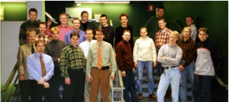
PPL-kurssilaiset kaiteen vasemmalla ja pursikurssilaiset oikealla puolella.

PPL-kurssi on ehtinyt suorittaa noin puolet teorioista; jäljellä on enää lentokoneen yleis-tuntemus, peruspsykologia, radiopuhelinliikenne, lekon suorituarvot, lentosuunnistus ja mittarilennon teoria. Jos jollain on oheisista aiheista rästitenttejä suorittamatta, ilmoittakoon asiasta kurssivääpelille ja huomatkoon, että tentit pidetään pääsääntöisesti ennen luentojen alkua maanantaisin ja keskiviikkoisin klo 16.00. Ensimmäiset lentäjäsankarit odottelevat jo oppilaskorttejaan ja hyviä lentosäitä.