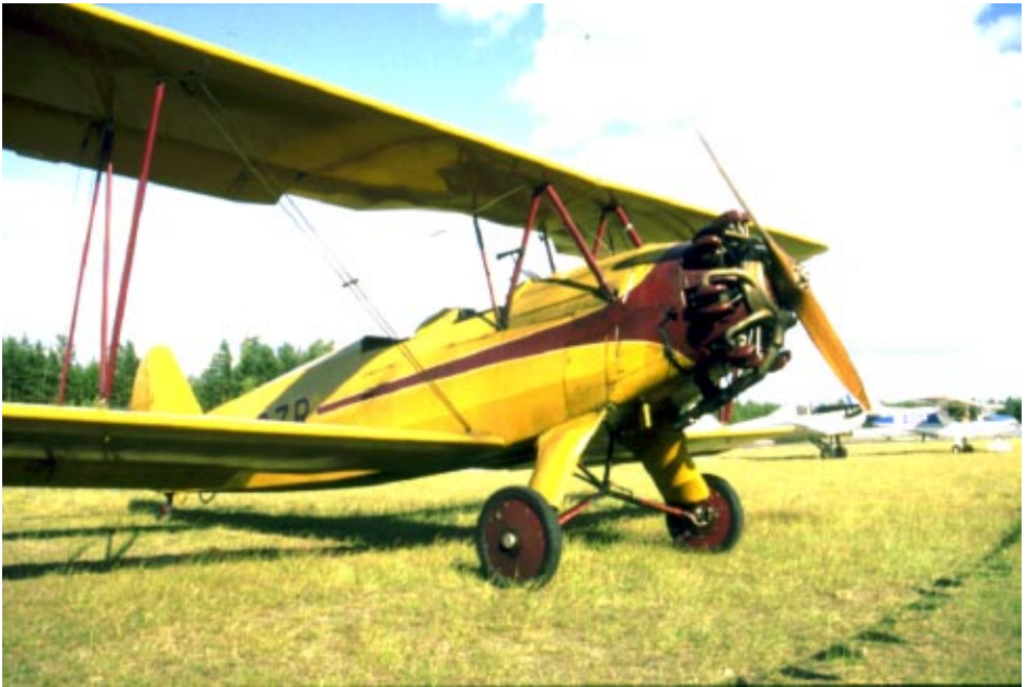
Toinen Stigu Hyvinkään Experimental-päiviltä. Ollapa kerhollakin tällainen kaunotar...