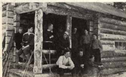
Leirin osantottajia jyvävän ja lämpimän kämpänässä portailta ruokaleven nautinnoissa.

Etä kaikki sujui ilman suurempia vaurioita, lienee osaltaan hyvän onnen, mutta myös hyvien koneiden, varo-