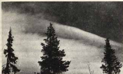
Pallaksen seuduilla oli havaittavissa komeita aaltopilvimuodostumia, joihin ei sopivan hinaus koneen puuttuessa päästy tarkemmin tutustumaan.

kiskoissa purjelentokoneita viimeiseen etappiin. Ääni oli kuin musiikkia korvilleemme.